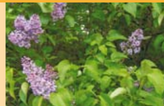
Gemeiner Flieder Syringa vulgaris