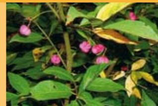
Pfaffenhütchen Evonymus europaeus