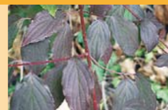
Roter Hartriegel Cornus sanguinea