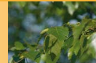
Birke Betula pendula