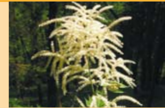
Waldgeissbart Aruncus dioicus