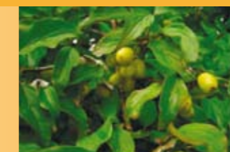
Kornelkirsche Cornus mas