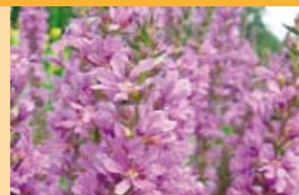
Blutweiderich Lythrum salicaria