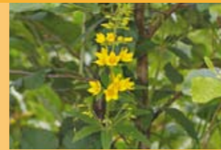
Gewöhnlicher Gilbweiderich Lysimachia vulgaris