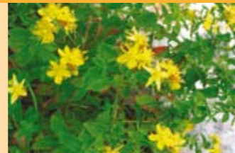
Johanniskraut Hypericum perforatum