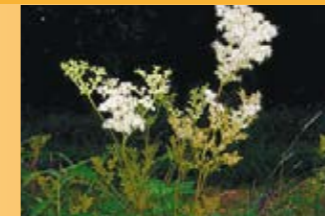
Mädesüss Filipendula ulmaria