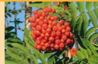
Vogelbeere Sorbus aucuparia