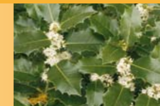
Stechpalme Ilex aquifolium