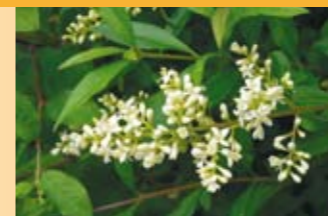
Gemeiner Liguster Ligustrum vulgare