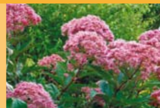
Gewöhnlicher Wasserdost Eupatorium cannabinum